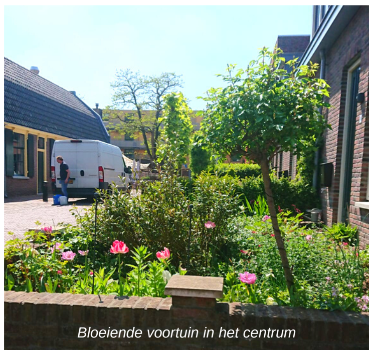
Bloeiende voortuin in het centrum