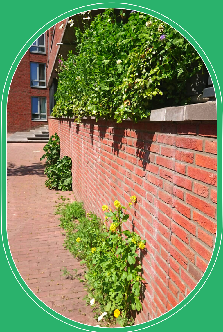
Bloeiend balkon in de Langestraat

Ook op een kleine buitenruimte kun je veel doen. Hoe mooi is het om vlinders, bijen en soms ook vogels op bezoek te krijgen? Klimplanten zijn makkelijk, maar er is tegenwoordig ook veel kant-en-klaar materiaal – balkonhekken, mini-moestuintjes en wormenbakken – om het eenvoudig te houden.