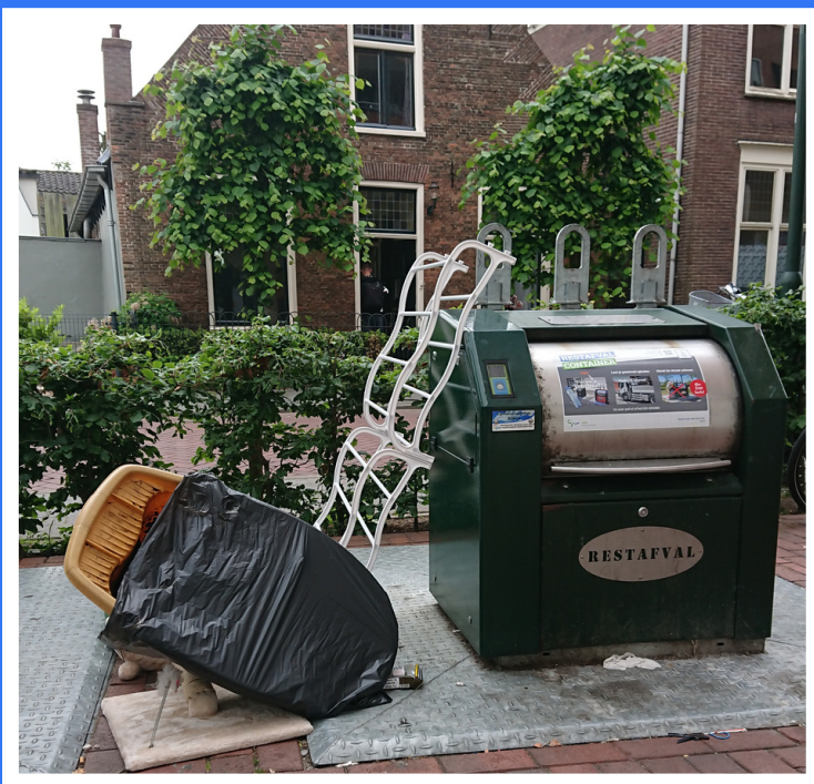
Huisvuil naast de container, Herenstraat Hilversum

Ja, ook dit is mogelijk! Je stopt dan het afval dat naast de container ligt erin (als dat tenminste past!) Afval bij de container gooi je bij het restafval en afval dat klem zit duw je erin of via de zijkant. Van het GAD krijg je de sleutel van de container en een schoonmaakpakket. Interesse? Mail dan naar afvalcoach@gad.nl . Meer informatie op de website van het GAD.