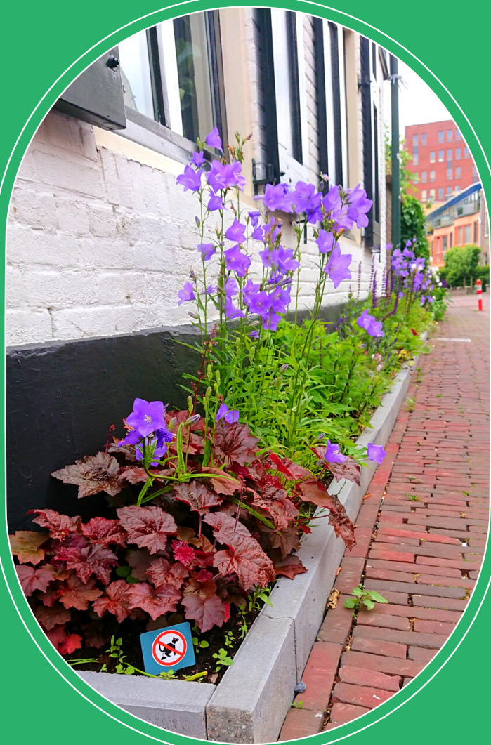
Een geveltuintje in het centrum

Geveltuinen zijn smalle groenstroken tegen de gevel, direct aan de straatkant. Een geveltuin doet wonderen voor het straatbeeld. Je kunt er ook grauwe gebouwen mee opfleuren. Iedereen in de buurt geniet mee van deze planten- en bloemenparadijsjes. Vooral straten zonder voortuinen zijn geschikt. Begroeiing van de gevel (bijvoorbeeld klimplanten) zorgt in de winter voor isolatie en in de zomer voor verkoeling. En je helpt de afvoer van regenwater. Klimplanten zoals kamperfoelie, klimrozen, passiebloem of clematis beschadigen de muur niet, maar zorgen wel voor meer groen.