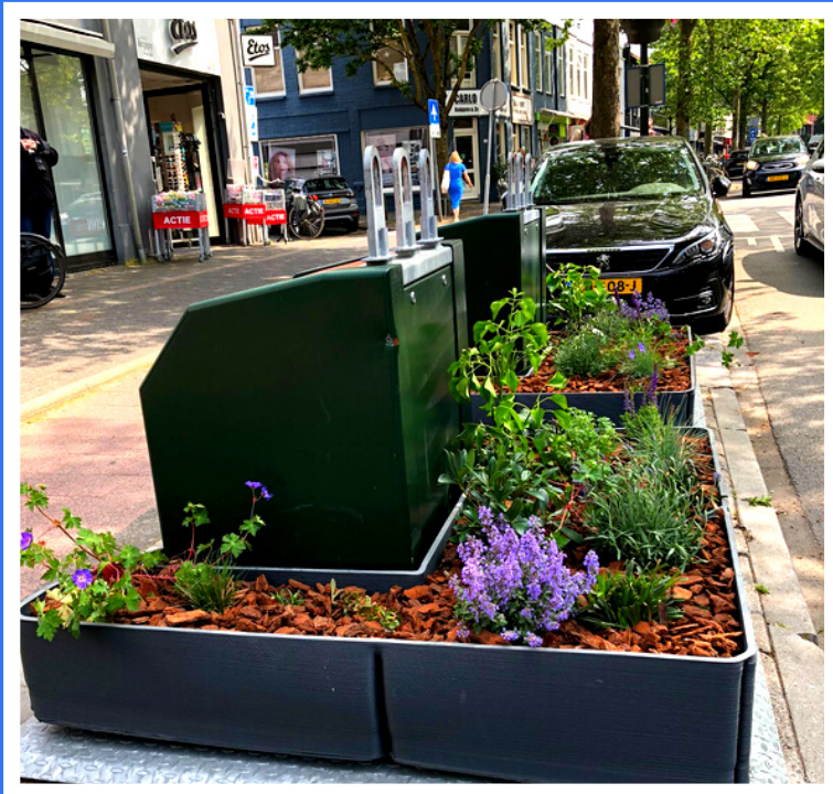
Een van de containertuintjes op de Gijsbrecht

Wil je dit ook in jouw buurt? Vraag naar de mogelijkheden bij jouw buurtcoördinator. Lees hier meer over containertuintjes.